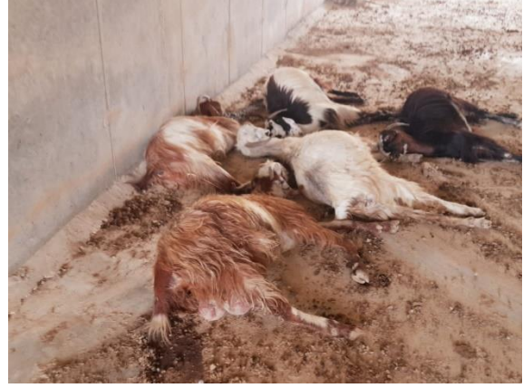
تسمم قطيع من الماشية الأغوار