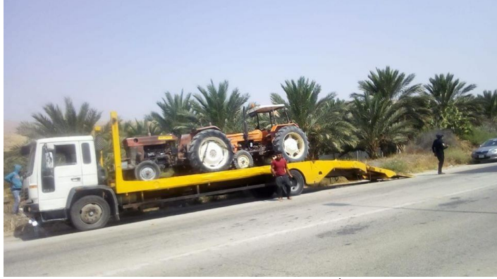
مصادرة تراكاتورات زراعية الأوغار