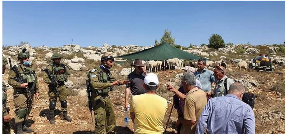
نصب خيام في بتيرابيت لحم