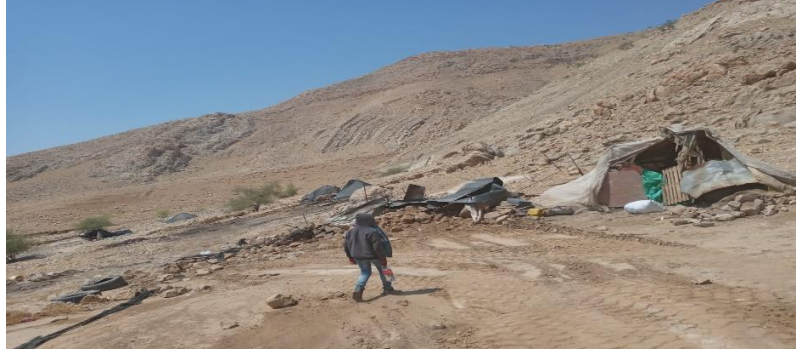
هدم حظائر، الفارسية، الأغوار