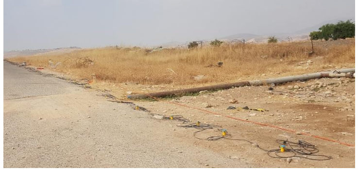
تمديدات أرضية لفحص منسوب المياه، الساكوت، الأوغار