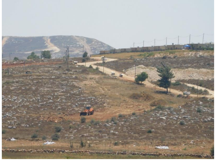
تجريف أراضي تابعة لقرى قريوت وجالودانابلس